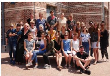
Gruppenfoto der Summer School-Teilnehmenden: Studierende der FH Dortmund und des University College Odisee in Brüssel