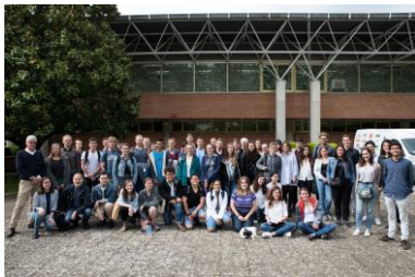
Gruppenfoto vor der Architektur- fakultät der Universität de Navarra